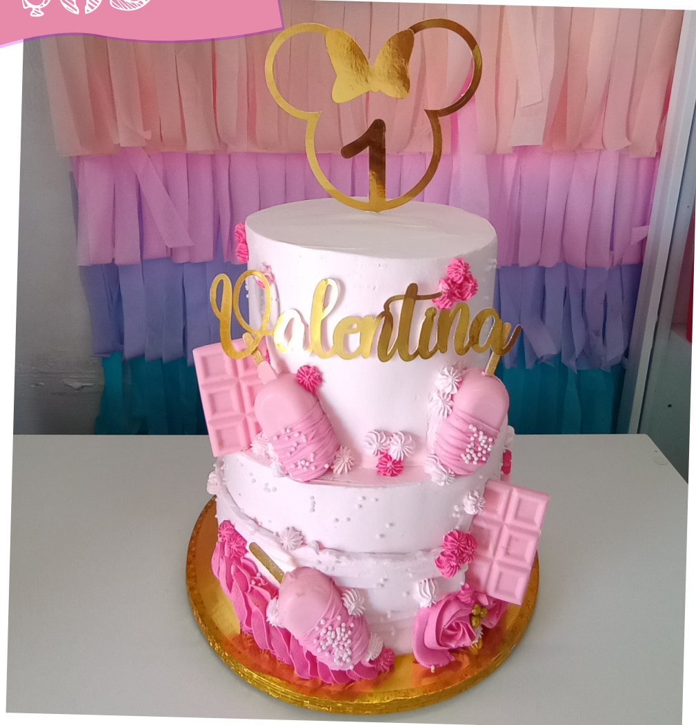
Merengue Con detalles de fondant o chocolate