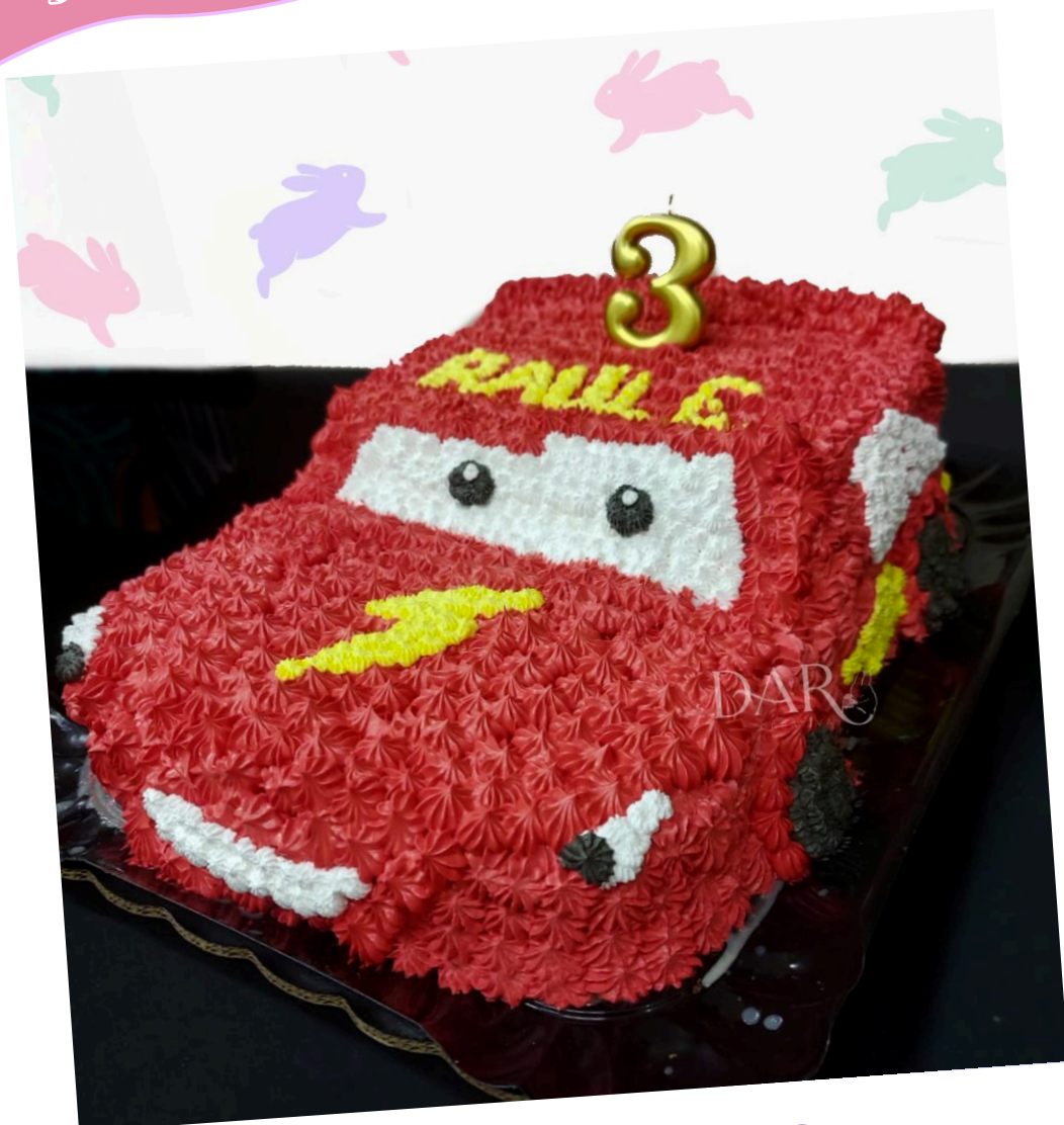
Merengue Dibujos y detalles de merengue