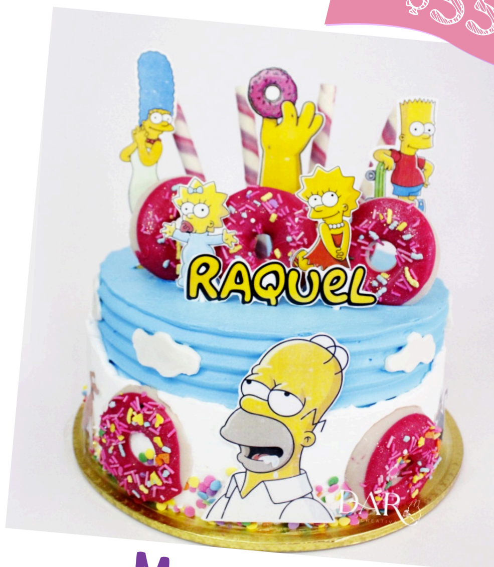
Merengue con Oblea Impresa ó impresión plastificada